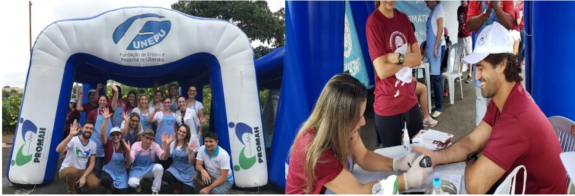
Figura 29- Novembro Azul- Teste de colesterol fracionado Unidade Dia