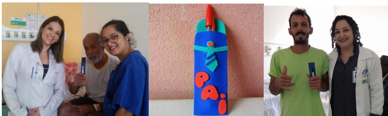
Figura 16- Teste de Colesterol Unidade Dia