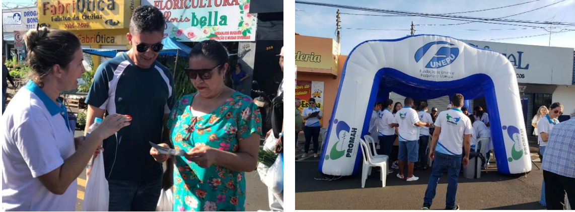
Figura 2- Dia Mundial da Saúde- Unidade Dia ABR 2019