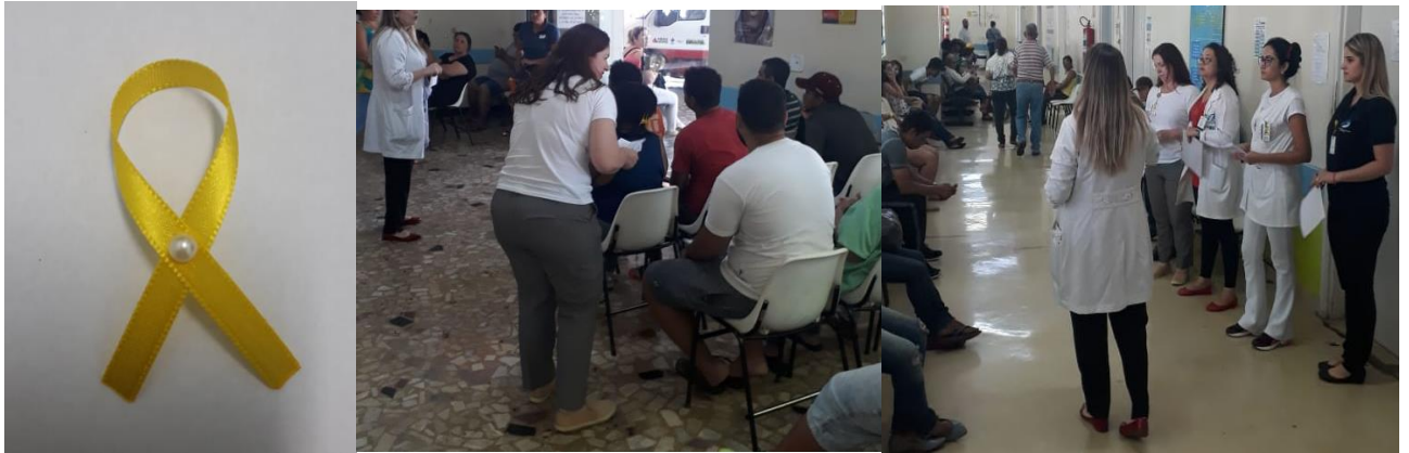
Figura 21- 1º Encontro Saúde do Trabalhador