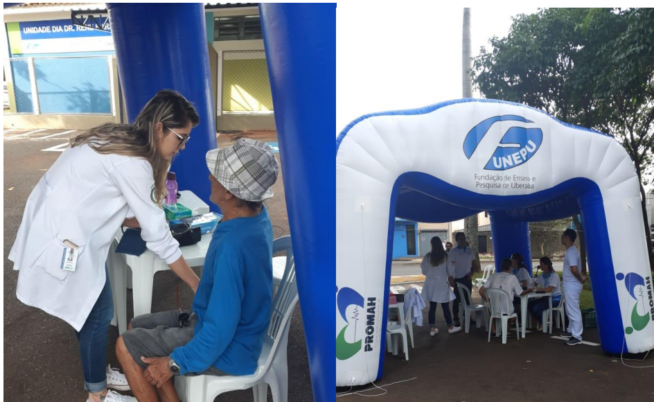
Figura 3- Sala de Espera- Dia Mundial de Combate ao Câncer ABR 2019