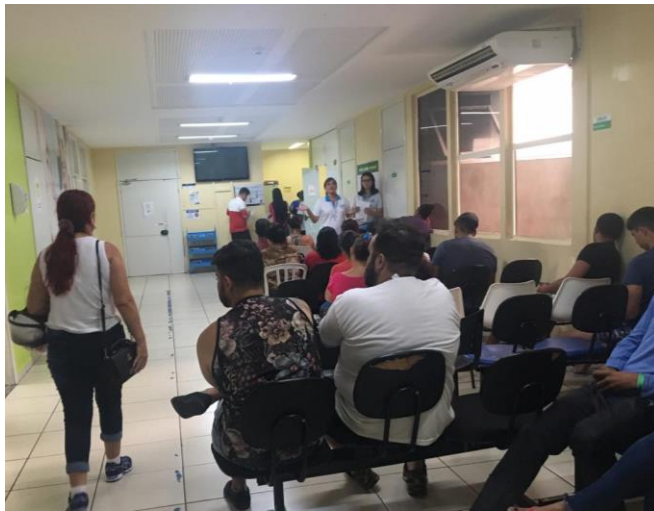
Figura 6- Dia do Trabalho: Entrega de lembrancinhas MAIO 2019