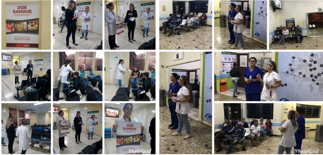
Figura 11- Dia D Saúde- Praça Jorge Frange JUN 2019